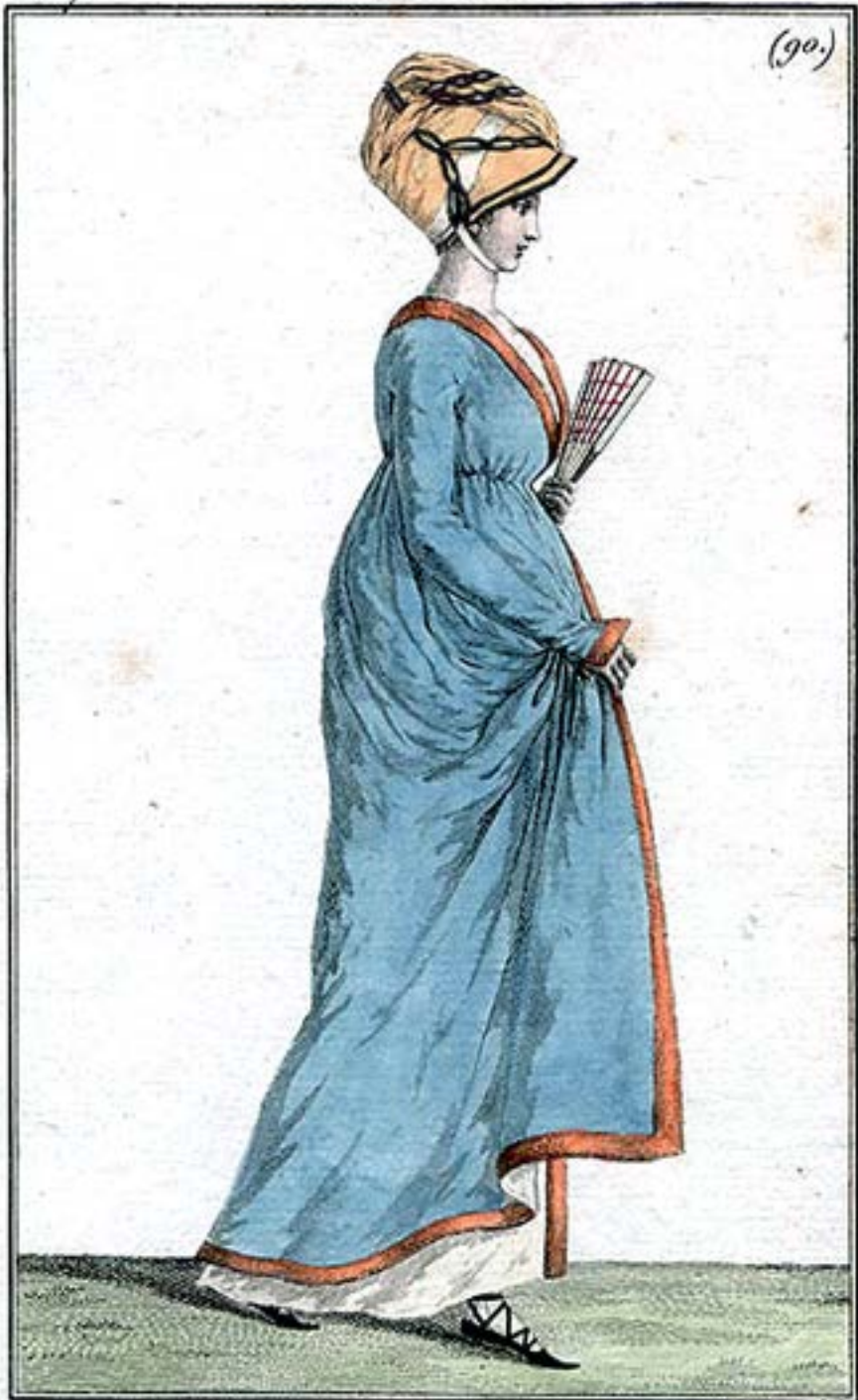
Chapeau à la Minerve, garni de Gances entrelacées Douillette bordée en Velours.