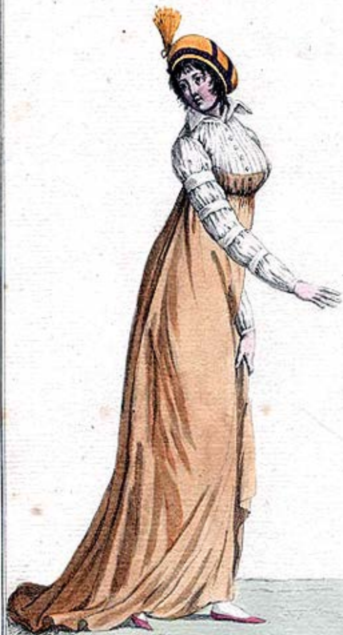
Chapeau-Capote. Manches en Amadis.