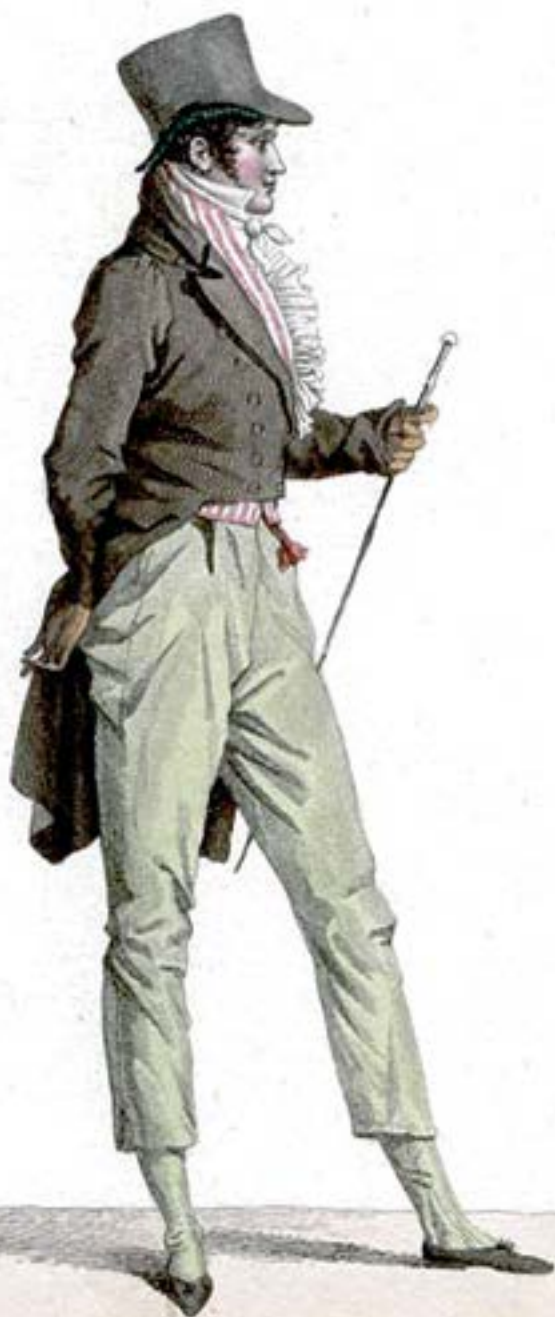
Costume négligé d'un jeune homme.