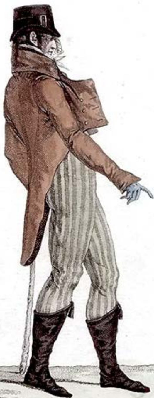
Costume d'un jeune homme.