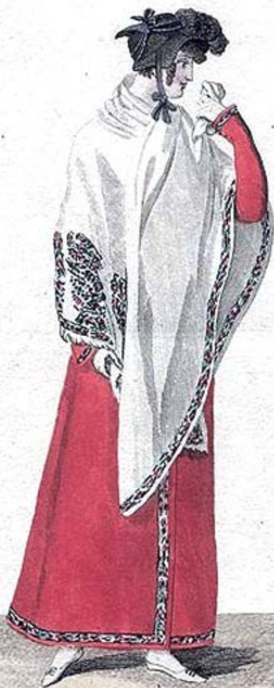
Chapeau de Paille. Redingote de Mérinos.