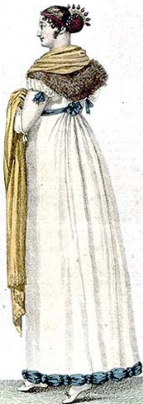
Coeffure ornée de Perles de Corail. Demi-Toilette.