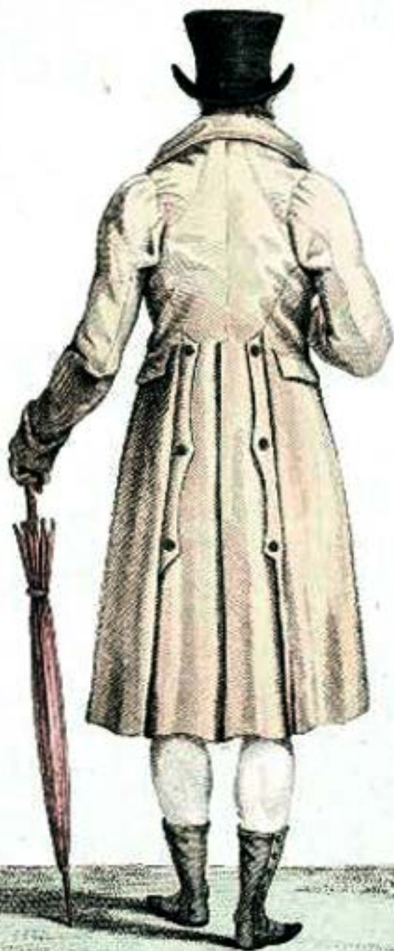
Redingotte à la Charlemagne. Quêtres de Drap.