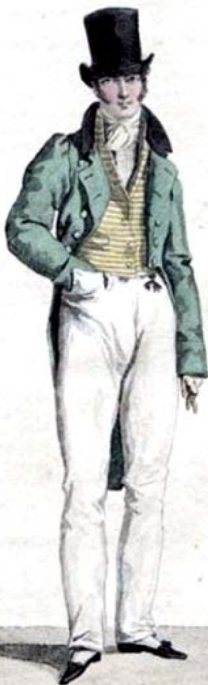
Habit à Collet de Velours. Gilet de piqué.