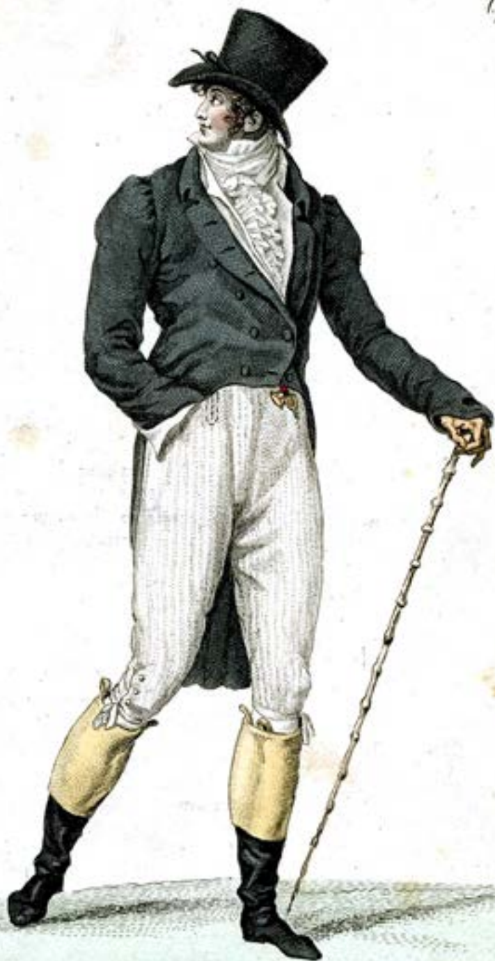
Habit Gris foncé. Culotte Côtelée. Bottes à Revers.