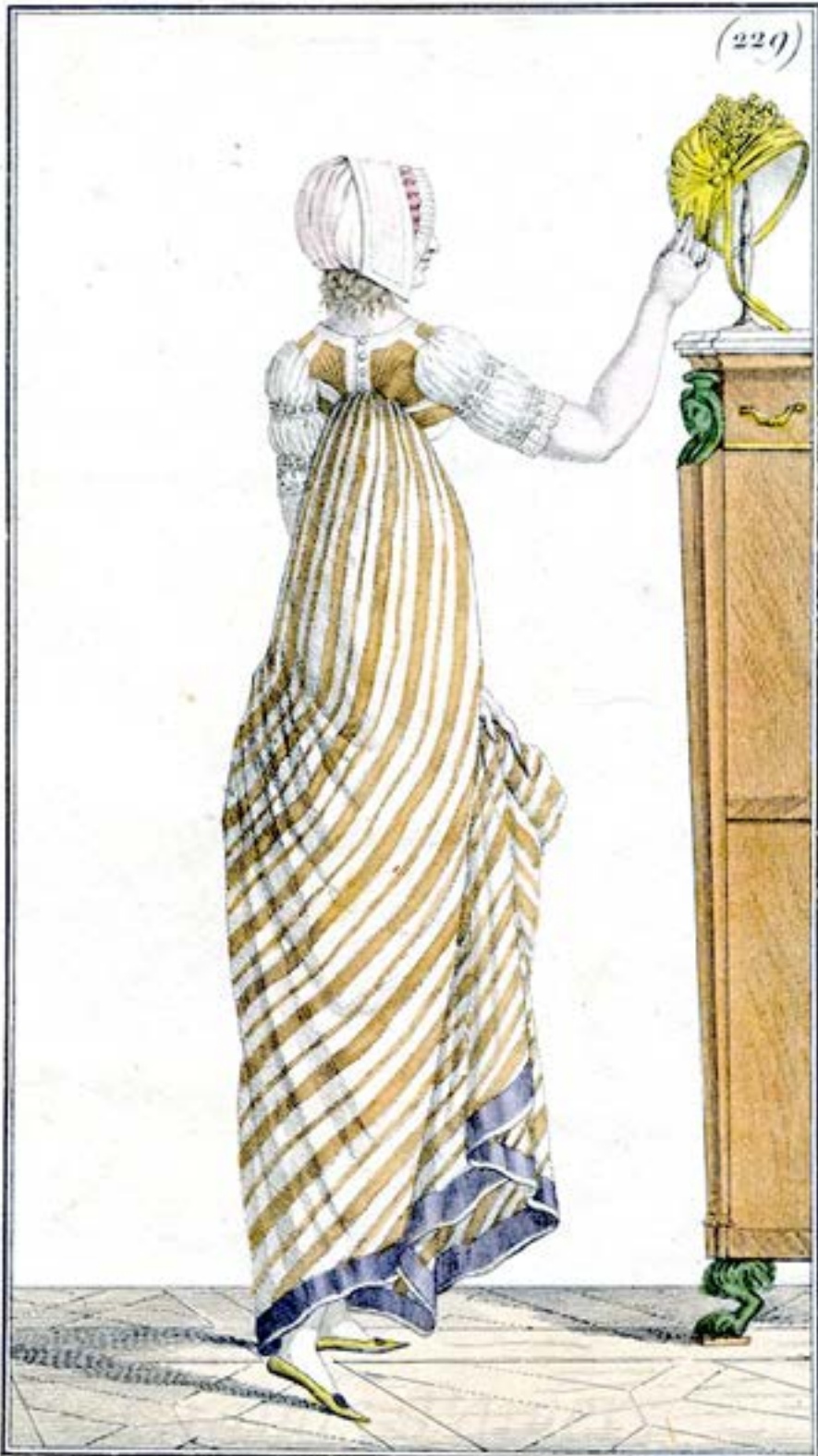
Demi-Paysane. Robe de Guingam.