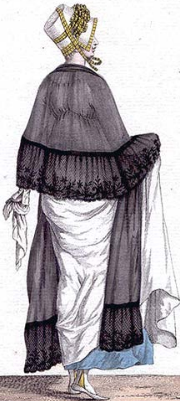
Chapeau de Paille, garni d'une Echelle de Rubans.