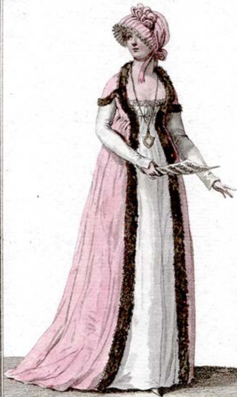
Capote de Satin Rose, Bordée en Gul. Doullette Garnie de sa Fourrure.