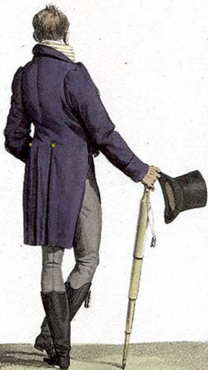
Habit sans Poches. Canne à Parapluie.