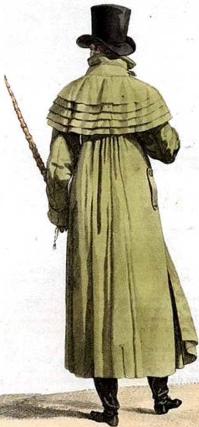
Carnock à cinq Collets fait en Redingote.