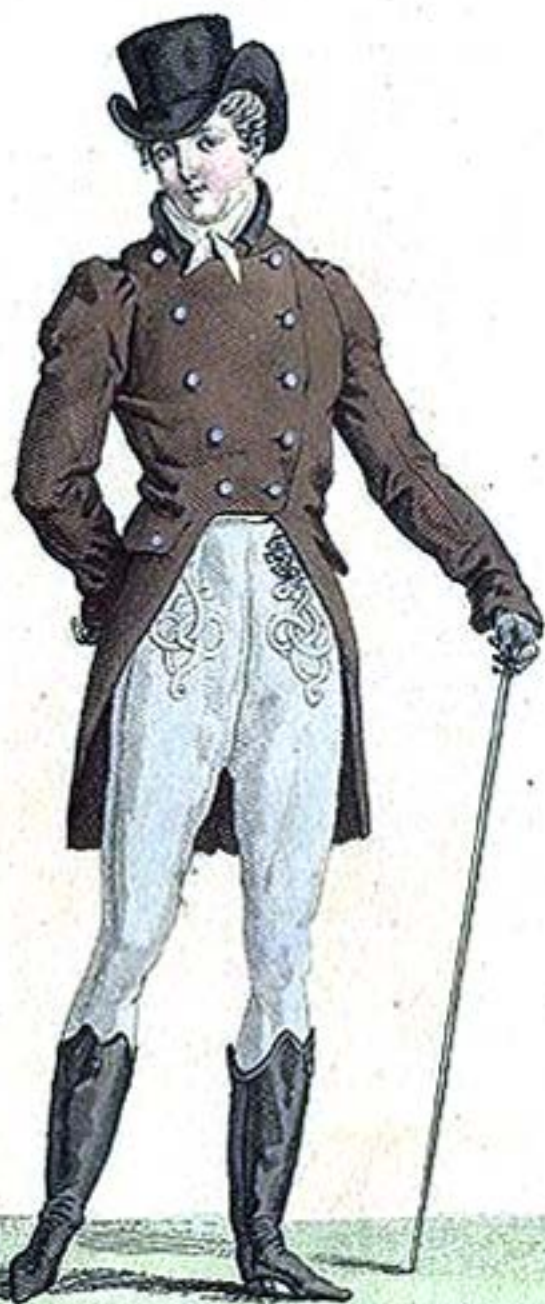
Chapeau l'entré. Habit à Collet étroit. Bottes à Talon haut.