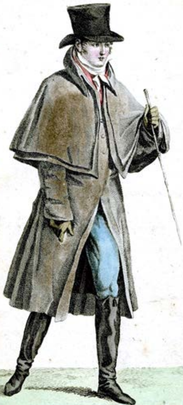
Mise de Jeune Homme 2.