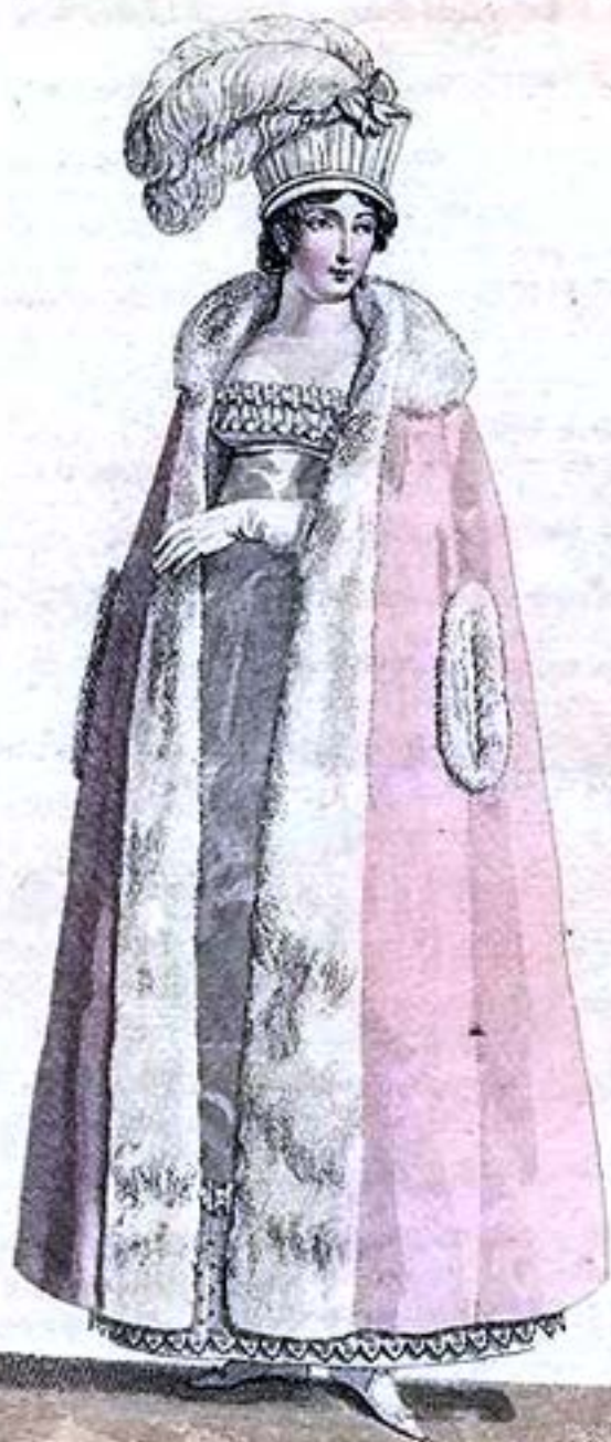
Coque de Velours. Pelisse de Velours épinglé.