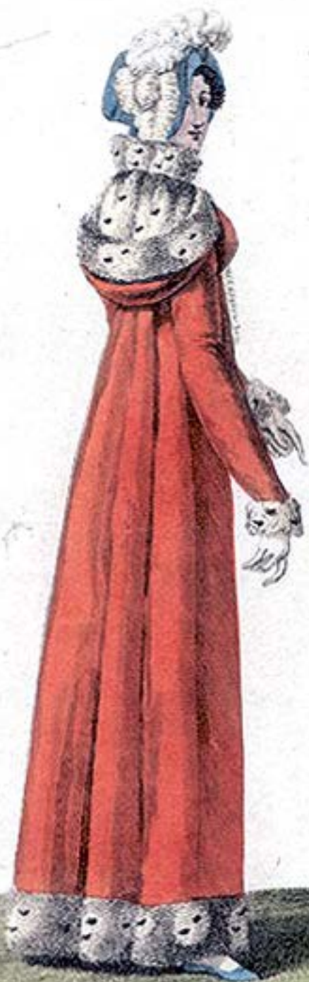
Chapeau de Velours. Redingote de Velours.