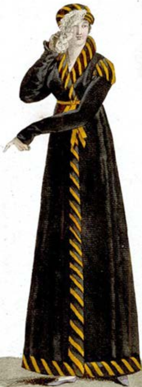
Coque et Redingote de Velours, garnies en satin.