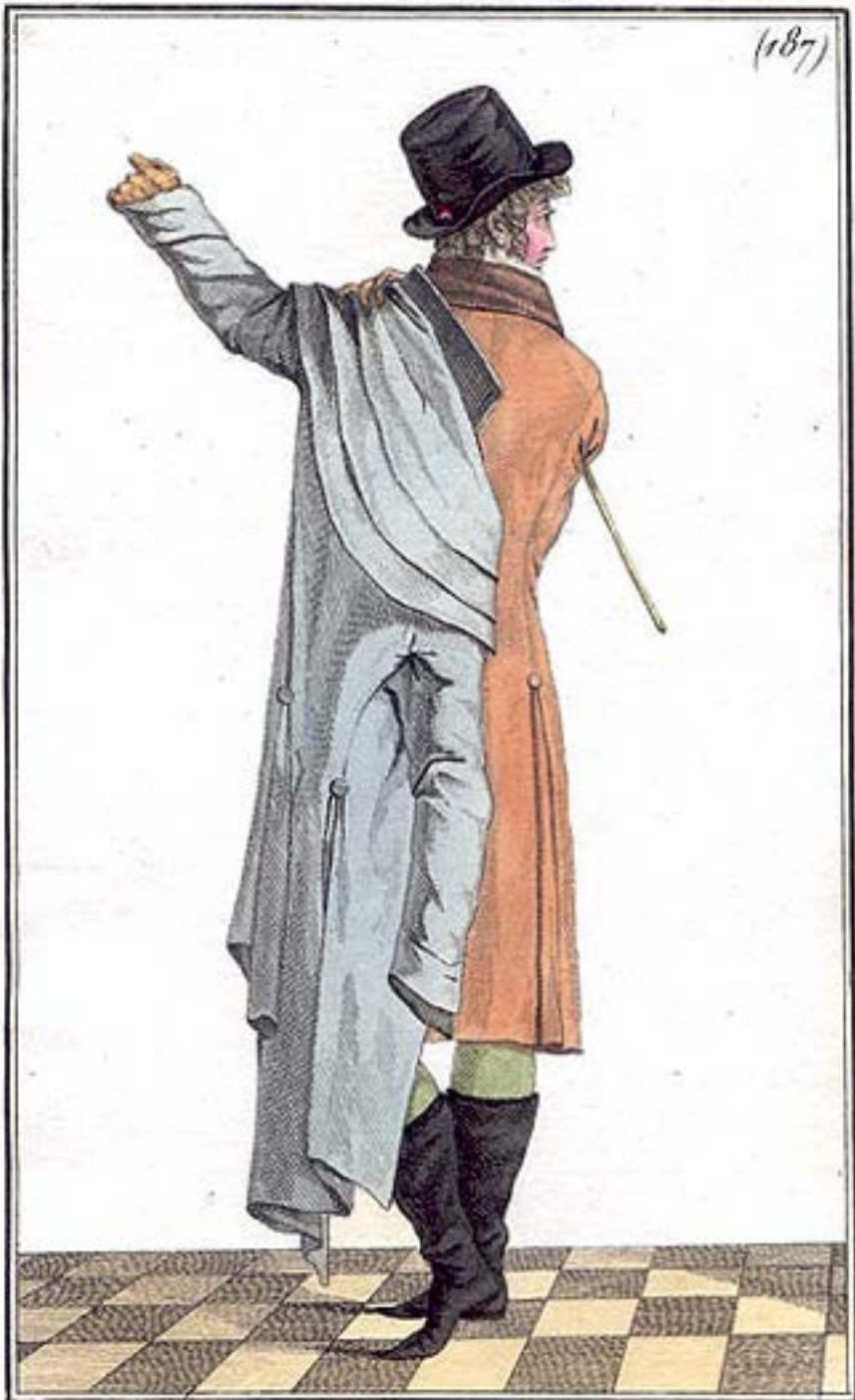
Mise d'un Élegant.