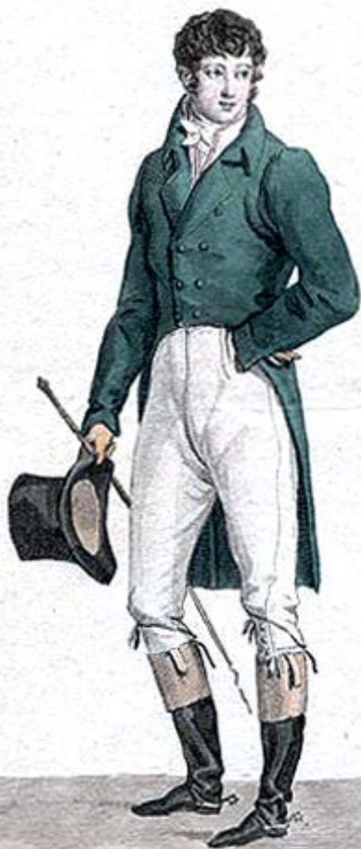
Habit de Drap. Gilet de cachemire sous un gilet blanc. Culotte de l'au.