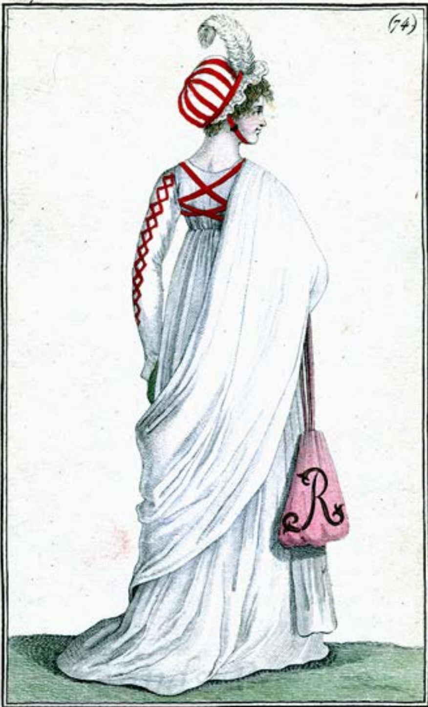
Turban au Ballon. Ceinture croisée. Ridicule à Chiffre.