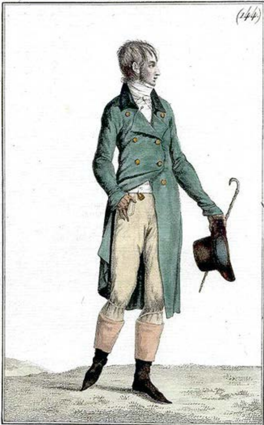
Ample Redingote. Large Pantalon.