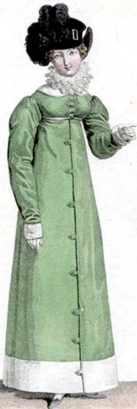
Chapeau à l'Anglaise. Redingote de Velours.