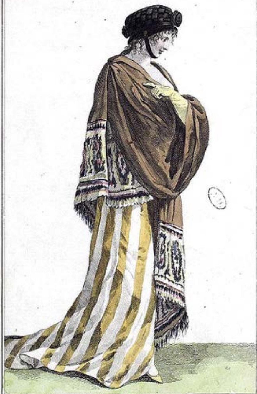
Chapeau de Crêpe quadrillé. Schall de Cachemire.