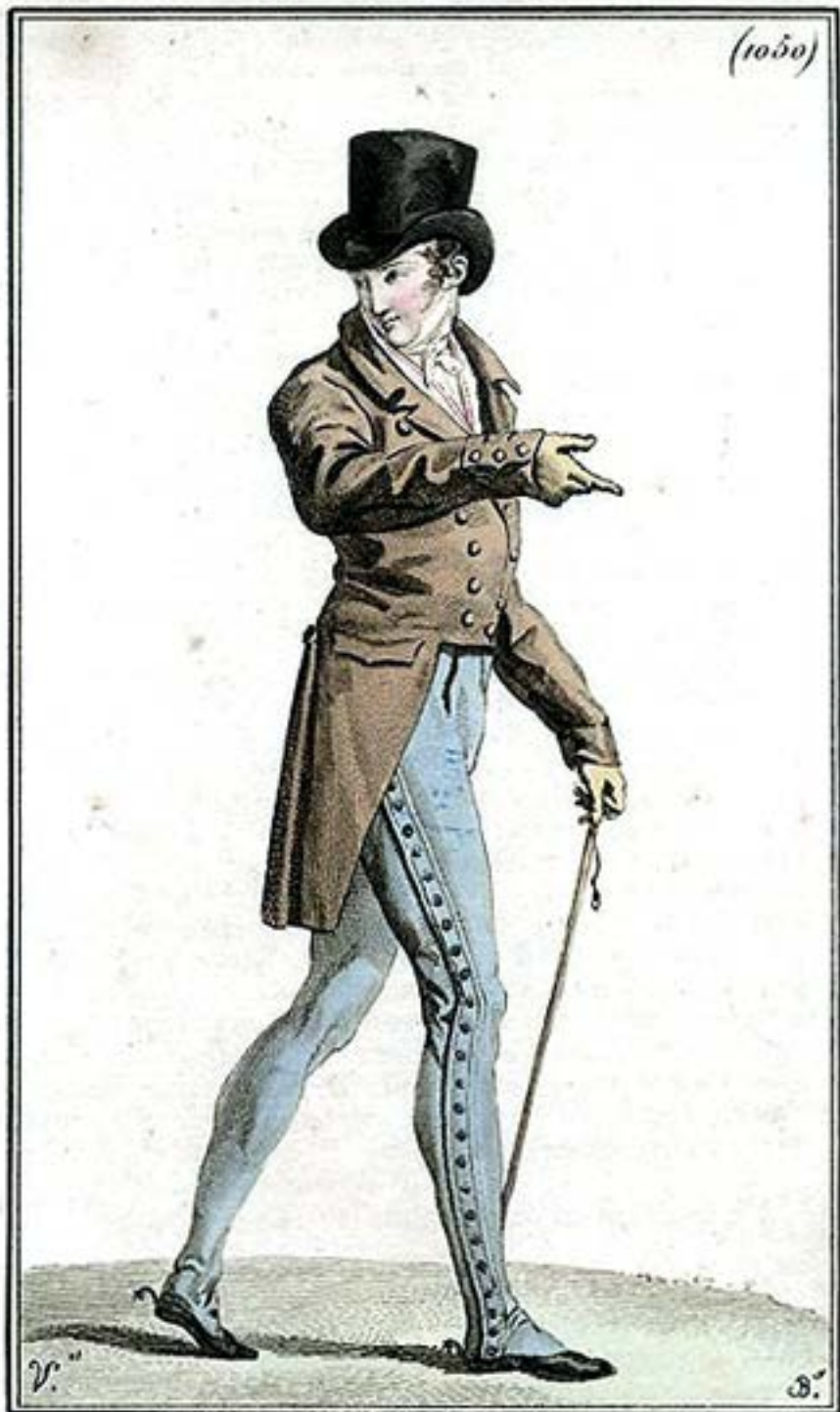
Pantalon de Drap Gris de fer, pour monter à Cheval. Souléris à Éperons Vissés aux Talons.