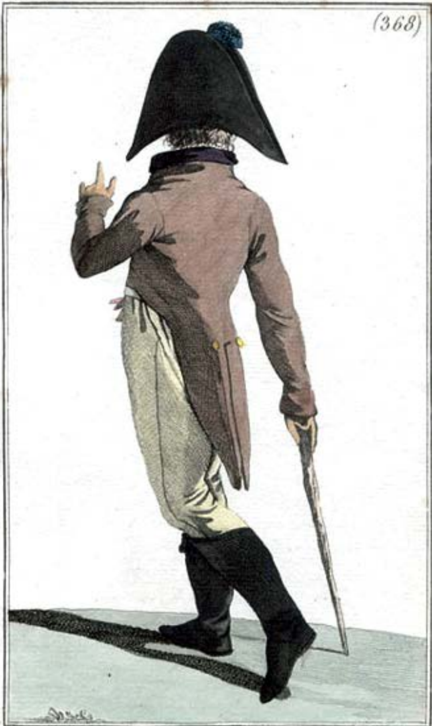
Chapeau à la Russe. Bottes sans Couture.