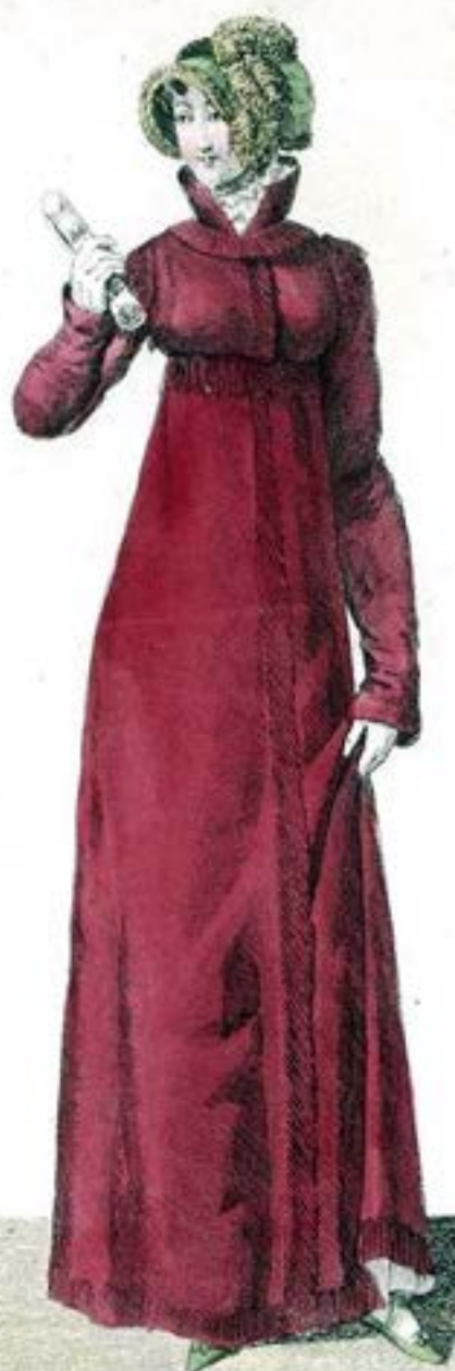
Chapeau garni en Pluche, avec Trois Plumes Panachées. Redingote de Mérinos.