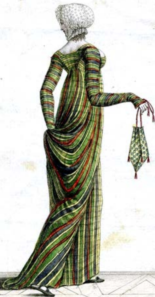
Coquet à Pointes. Robe de Madras.