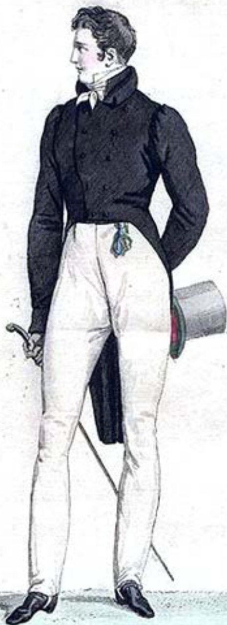
Habit à l'Anglaise. Pantalon à l'Anglaise.