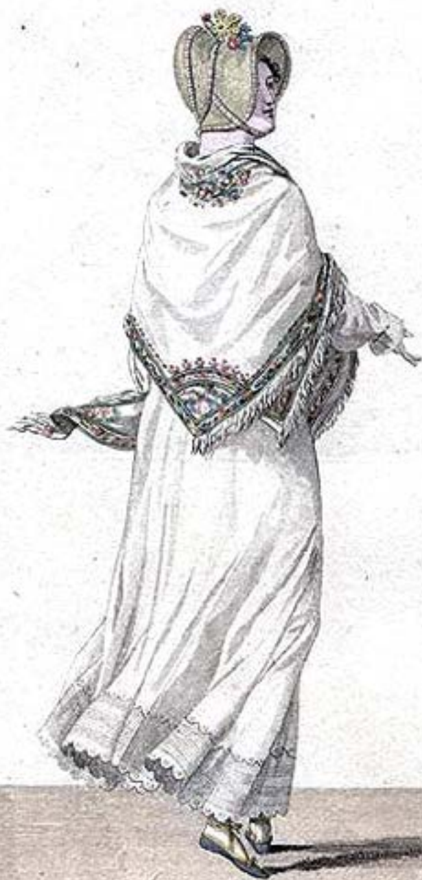
Chapeau phrygien, en sparterie. Robe de Percale.