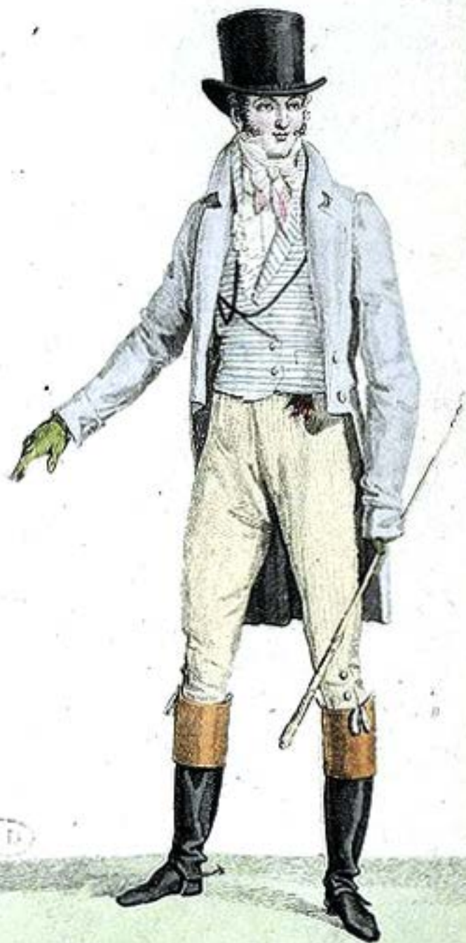
Habit de Drap. Gilet de Piqué. Culotte de Casimir Bombé.