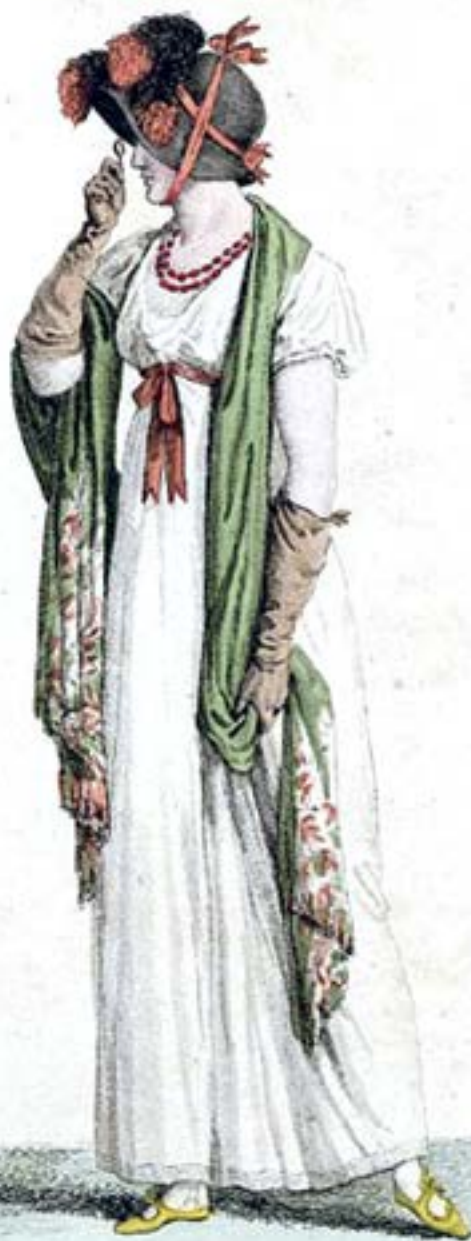
Négligé pour la Promenade.